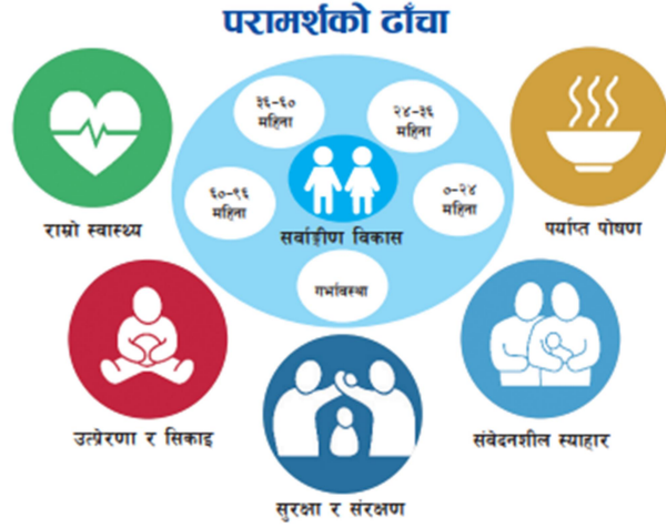
उपयुक्त वातावरण (अर्थ: समन्वय, व्यवस्थापन, समुदायको संलग्नता र क्षमता)

प्रारम्भिक बालविकासको रणनीति योजना निर्माणका लागि आयोजना गरिएको दुई दिने कार्यशालाले रणनीतिक योजनाको प्रारम्भिक खाकाको छलफल गर्नुका साथै योजनाको पहिलो मस्यौदाको बाटो तयार गरेको थियो । उक्त मस्यौदालाई उपयुक्त ढाँचामा तयार गरी प्राप्त पृष्ठपोषणलाई संवेदन गर्दै योजनाको अन्तिम प्रारूप तयार गरी नगरपालिकामा अनुमोदनको लागि प्रस्तुत गरिएको थियो ।